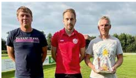
Die Sponsoren: Der landwirtschaftliche Betrieb Teepker aus Handrup und der Firma Zimmerei Brockhaus aus Gersten.