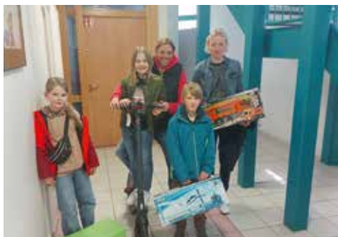
Gewinner der Tombola

Bereits im April feierte die Grundschule Lengerich ihr Schulfest mit einem vielfältigen Programm für Groß und Klein. Das Tanzprojekt, das in der Woche zuvor stattfand und unter anderem vom Förderverein finanziell unterstützt wurde, wurde am Schulfest eindrucksvoll präsentiert. Im Anschluss an die Tanzaufführung konnten sich die Besucher an einer reichhaltigen Kuchentafel und einem herzhaften Imbiss stärken. Die Kinder hatten großen Spaß auf den Hüpfburgen und beim Kinderschminken, während Selbstgebasteltes und das köstliche Brot vom Heimatverein zum Verkauf angeboten wurden. Die große Tombola, die durch die großzügigen Geld- und Sachspenden zahlreicher Unterstützer ermöglicht wurde, rundete den Tag ab und sorgte für viele glückliche Gewinner. Ein herzlicher Dank geht an alle Beteiligten, die durch ihre Unterstützung und ihr Engagement zum Erfolg des Schulfestes beigetragen haben. Dank ihrer Mithilfe konnte ein erheblicher Erlös erzielt werden, der entscheidend für die Finanzierung zukünftiger Projekte und Aktivitäten unserer Schule ist.