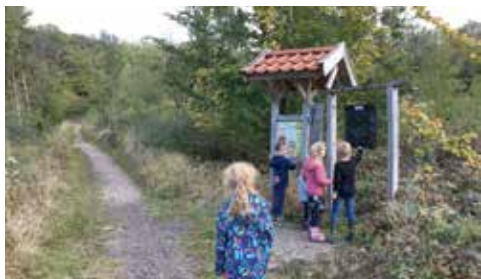
Kinder unterwegs auf dem Walderlebnispfad Stoverner Wald