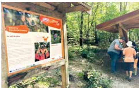
Erlebnispfad Wald.Lern.Revier, Lingen-Darne - Waldpädagogin Cornelia Köster mit Kindergruppe

Wie in Salzbergen können sich kleine und große Entdecker anhand von Infotafeln über die Bäume und Tiere des Waldes informieren und verschiedene Mitmach-Angebote ausprobieren. Das Maskottchen „Finn, der Fuchs“ begleitet die Besucher bei der Tour im Wald.Lern.Revier und vermittelt auf den neuen Infotafeln spannende Fakten über den Wald, den ehemaligen Bahnübergang und eine alte Allee, deren Spuren sich noch im Wald finden lassen.