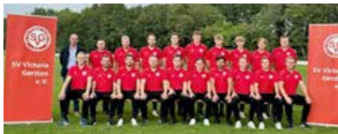
Beim Fototermin überreichte die Mannschaft als kleines Dankeschön Präsentkörbe an Ihre Sponsoren.

Es ist großartig zu sehen, dass regionale Firmen unser Team auf diese Weise fördern und unterstützen.