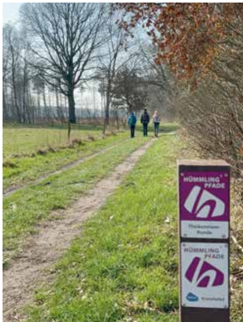
Herbstspaziergang auf dem Kranichpfad

Der Kranichpfad führt vorbei an der Aussichtsplattform mit Blick auf die Wehmer Dose, einem Hochmoor mit einem darin liegenden See. Mit etwas Glück können Naturbegeisterte dort und von einer Vogelbeobachtungshütte am Ende des Pfades Kraniche und andere Wasservögel betrachten. Infotafeln am Wegesrand erklären die hochmoortypische Tier- und Pflanzenwelt des 250 Hektar umfassenden Areals und verdeutlichen die Bedeutung von einem der ältesten Naturschutzgebiete Deutschlands.