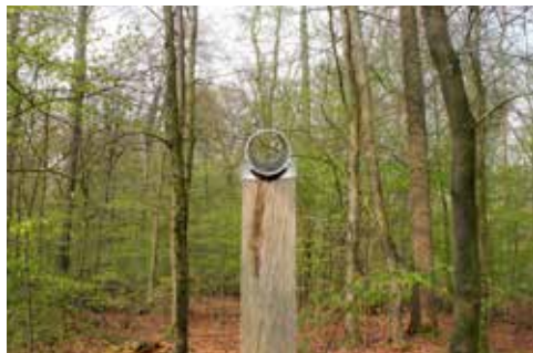
Walderlebnispfad Stoverner Wald in Salzbergen