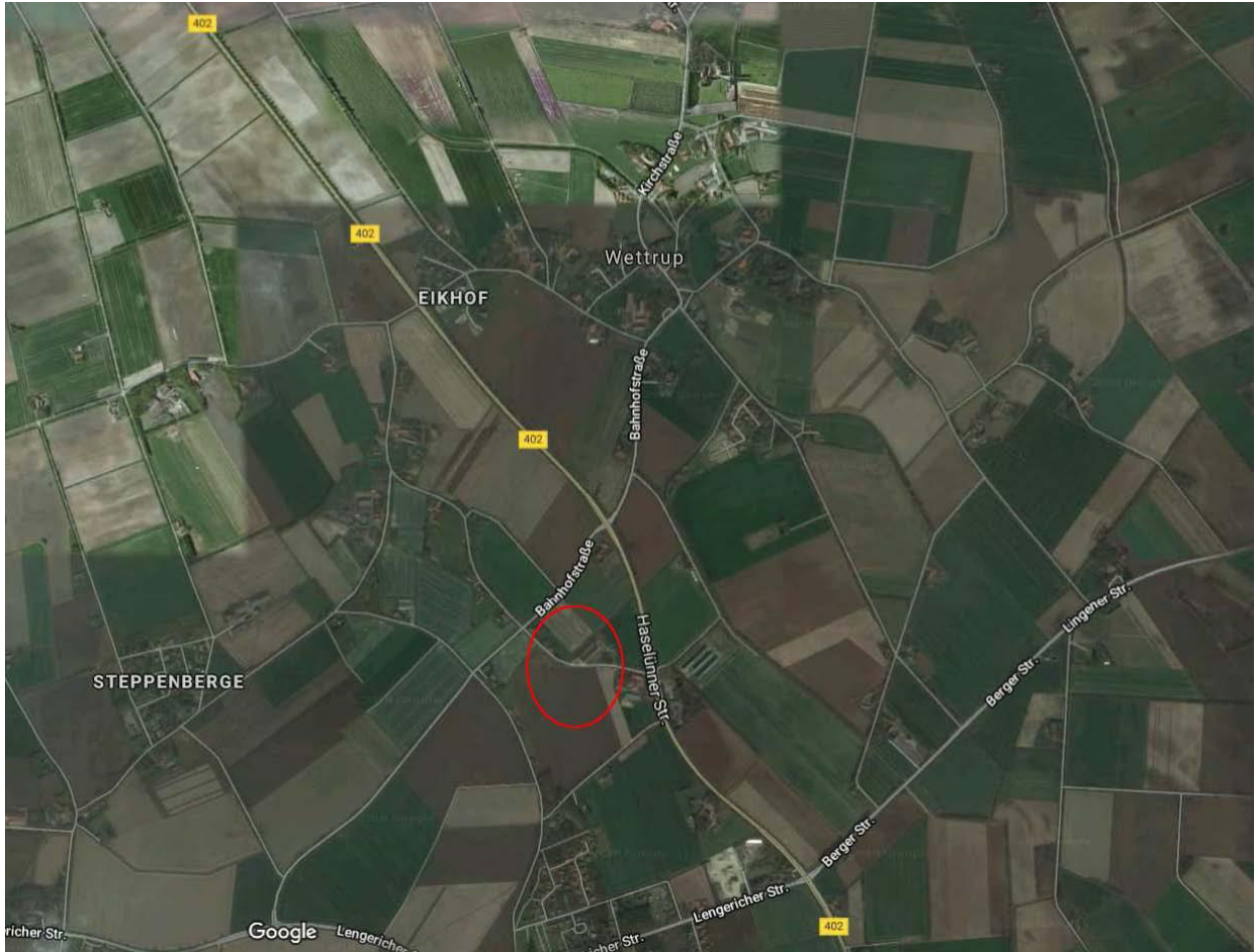
Abbildung 1: Lage des UG im räumlichen Zusammenhang (google maps, Stand: 03.07.2018)