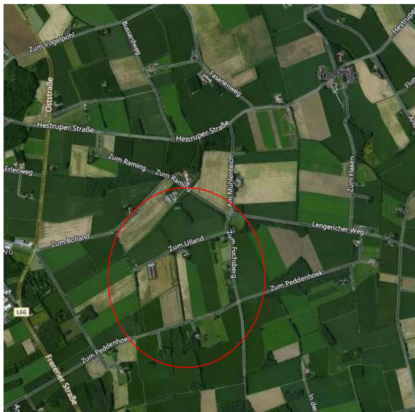
Abbildung 1: Lage des UG im räumlichen Zusammenhang