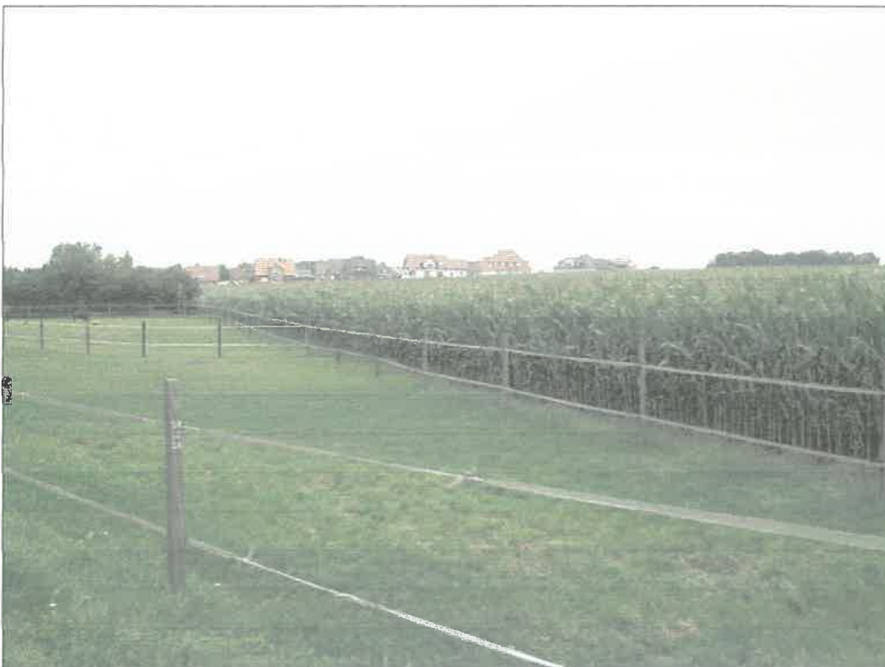
Foto 1: Blickrichtung Norden auf das Plangebiet: im Vordergrund und links GI, rechts Ackerfläche mit Mais bestanden; im Hintergrund die Wohnsiedlung „Kirchhöfel“