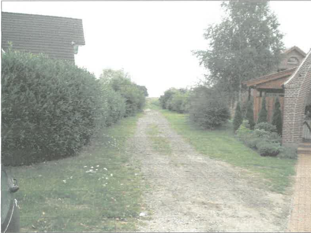
Blickrichtung Osten in den Sandweg (DWS); rechts Wohnhaus u. Hausgarten (PH)