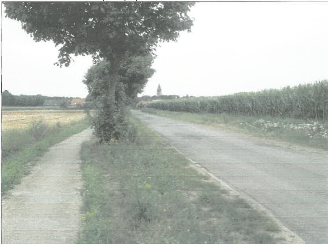
Espeler Straße mit begleitendem Radweg und Baumreihe aus Bergahorn (Blickrichtung Norden); rechts Ackerflächen mit Mais, im Hintergrund Ortschaft Langen

OVS Straßenverkehrsfläche; hier „Espeler Straße“